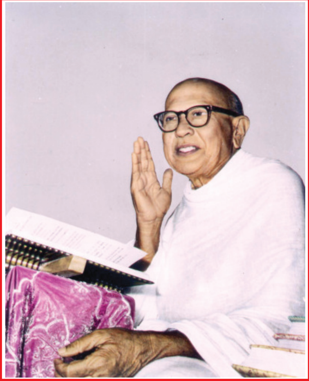
अध्यात्मयुगसर्जक पूज्य गुरुदेवश्री कानजीस्वामी