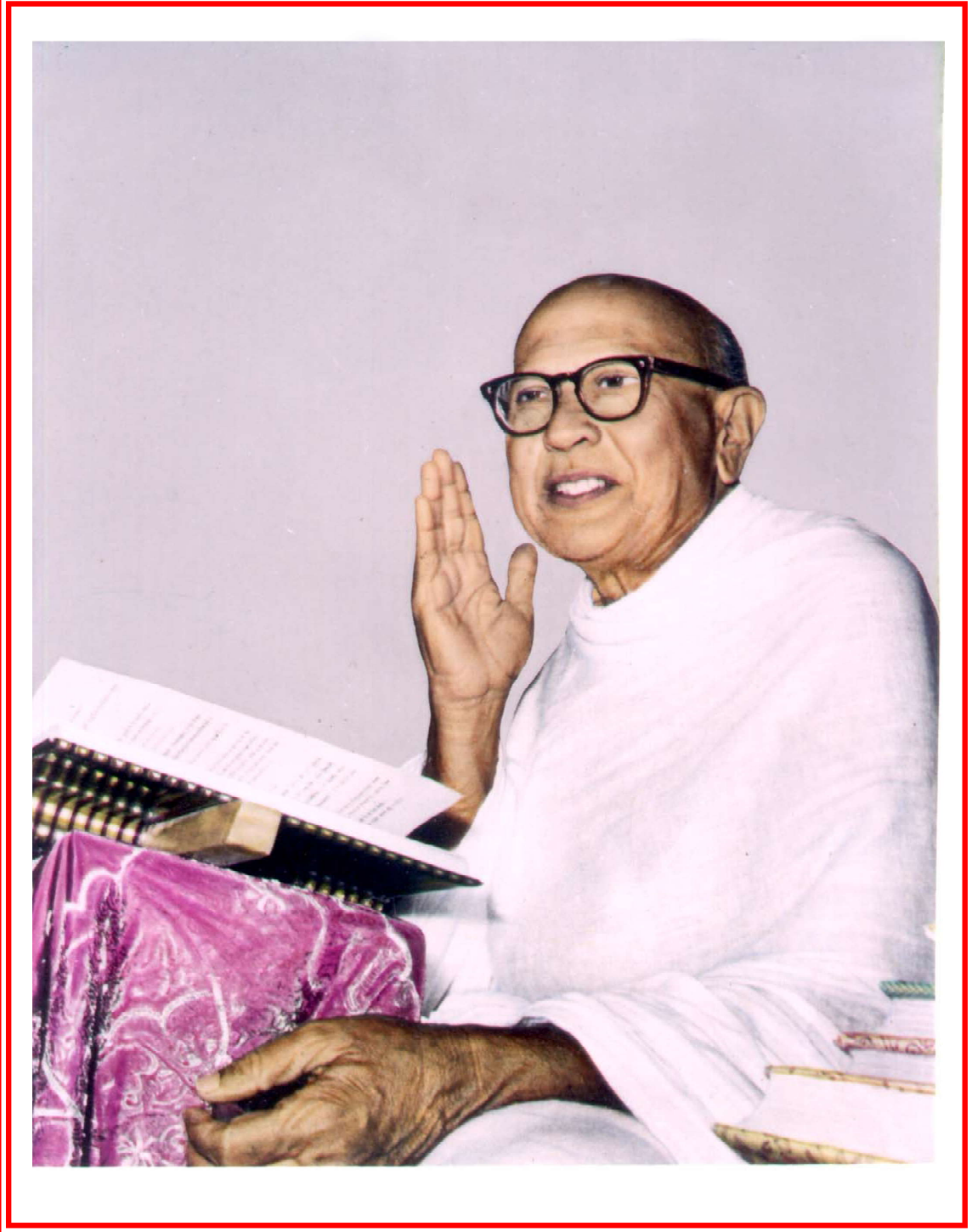
अध्यात्मयुगसर्जक पूज्य गुरुदेवश्री कानजिस्वामी